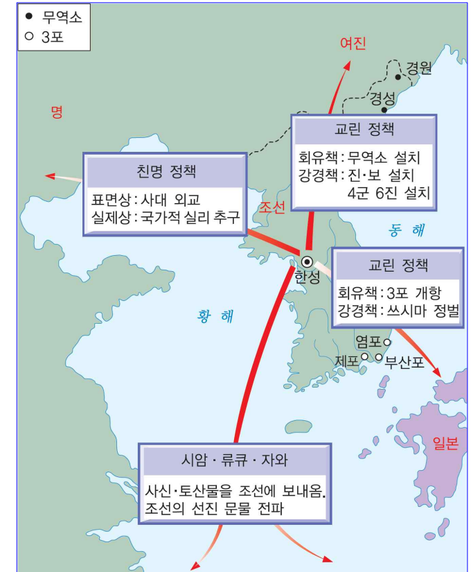
<조선 전기의 대외 관계>